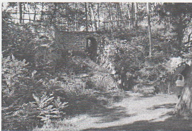
Der bizarre Landschaftsgarten hinter dem Schloss Nexing

eines Weinviertler Dorfes von anno dazumal gezeigt. Alte Weinviertler Bauernhöfe, Handwerkerhäuser, Kapellen, Wirtshaus, Schule und Keller aus zwei Jahrhunderten wurden von ihren ursprünglichen Standorten abgetragen, überstellt und in Niedersulz wieder aufgebaut.