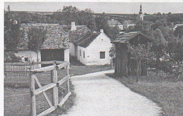
Weinviertler Museumsdorf Niedersulz

Es war ein wunderschöner Ausflug bei strahlendem Sonnenschein in eine Gegend Niederösterreichs, die vor allem noch durch die Beschaulichkeit der Landschaft, durch den Charme und die Gastfreundschaft der Bewohner punktet. Ein herzliches Dankeschön an dieser Stelle an den Familienbetrieb Landgasthof Mann in